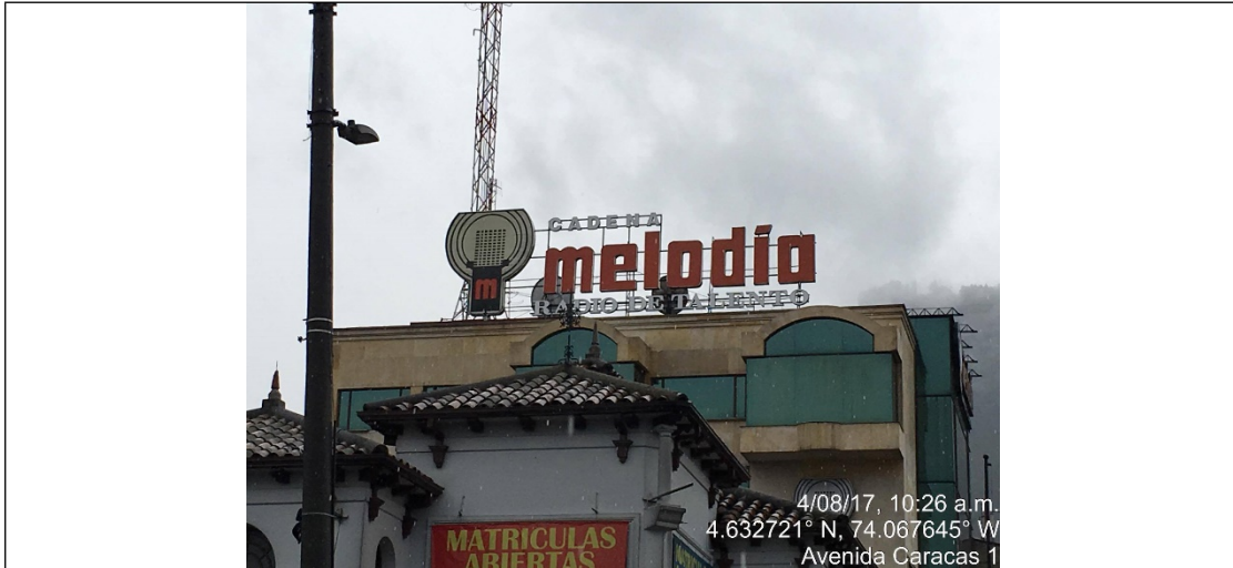
Fotografía No. 1 Vista panorámica del aviso del edificio CADENA MELODIA ubicado en la Calle 45 No. 13 – 70, el cual no cuenta con solicitud de registro.