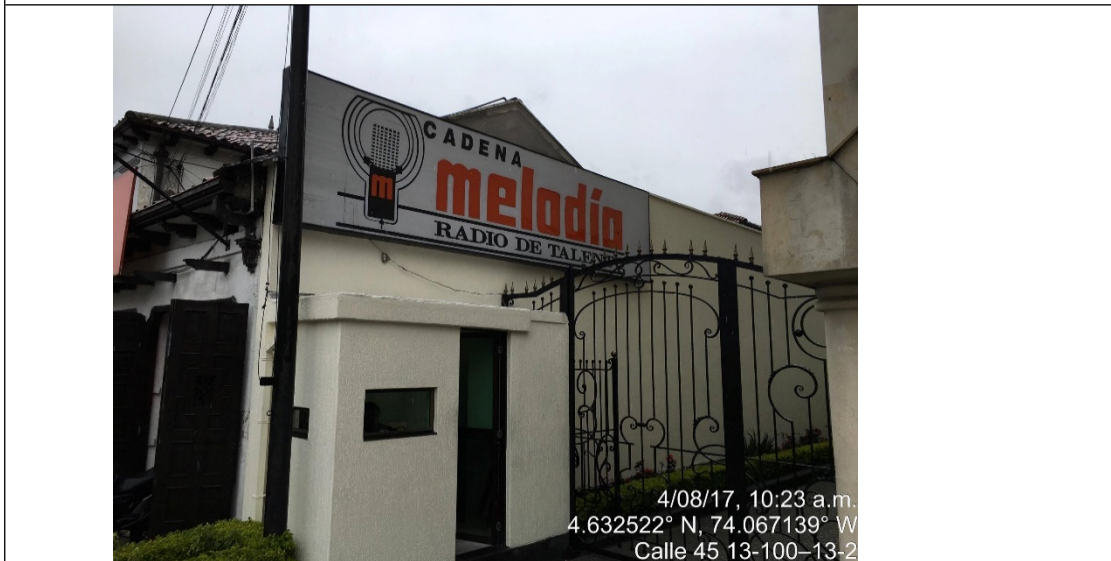
Fotografía No. 4 Vista del aviso en fachada del edificio CADENA MELODIA, ubicado sobre la Calle 45 No. 13 – 70, el cual no cuenta con solicitud de registro.